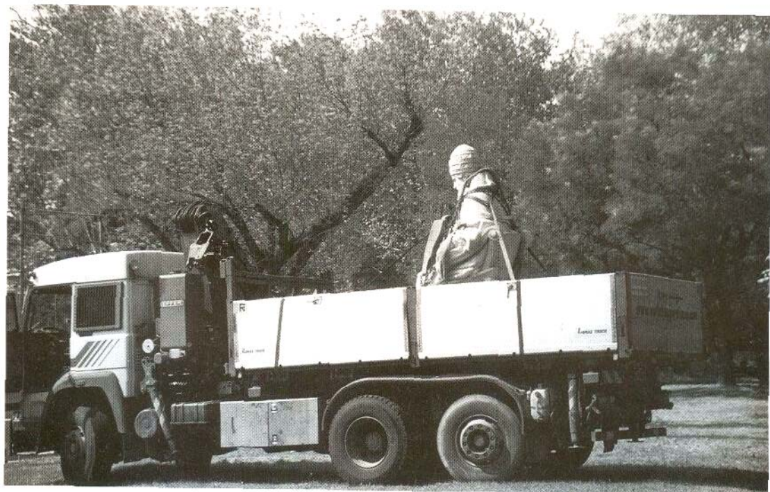
Il "viaggio" della statua