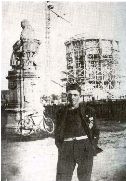
La statua di Paolo V ancora in loco

15 ottobre - Presentazione del percorso / luoghi di Lucrezia con scoprimento di targhe turistiche e visita al convento del Corpus Domini e alle Tombe Estensi.